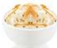
Salade de Choux